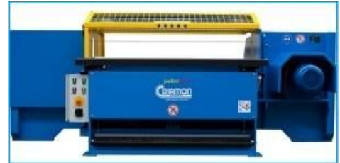
PalletSaw Ausgezeichnet geeignet um defekte Teile zu entfernen oder Paletten komplett zu zerlegen.

Die oben genannten Maschinen können in viele Reparatursysteme, die Cekamon Saws anbietet, integriert werden. Für Informationen Klicken Sie hier!