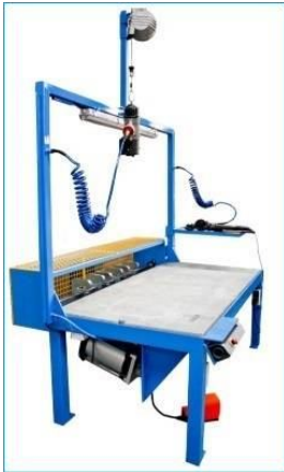
BoardRemover Mit Knopfdruck, das Außenbrett (unten oder oben) entfernen