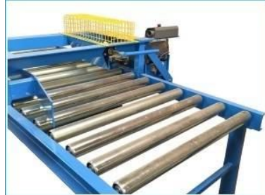
PalletPress Ein Mitarbeiter entfernt die defekte Bretter und Klötze und zwei Mitarbeiter ergänzen die Paletten.