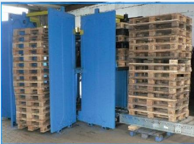
Baujahr 2015 (so gut wie neu)