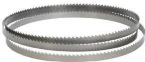
Verfügbar in 27 & 34 mm

Dies ist der erste Newsletter, den wir Ihnen im Jahr 2016 senden. In diesem Newsletter lesen Sie alles über unser Sortiment an Sägen, die ab Lager lieferbar sind. Wir werden Sie auch im Jahr 2016 über alle neuen Entwicklungen in unserem Unternehmen informieren und Sie können wieder mit den hervorragenden Service von CekamonSaws rechnen.