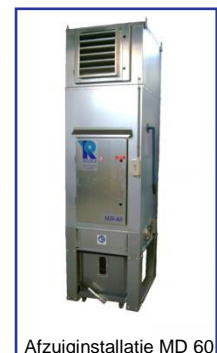
Afzuiginstallatie MD 60