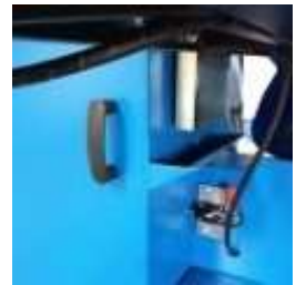
Afzuigpunt rook, stof en zaagsel

De vernieuwde PalletSaw is uitgerust met afzuigpunten voor rook, stof en zaagsel, zodat men naast de besparingen op de reciprozaagjes ook veel minder rook en stof heeft. Deze afzuigpunten kunnen worden aangesloten op een centraal afzuigstelsel of op een losse unit die door CekamonSaws wordt geleverd. Het dragen van mondkapjes is daarmee overbodig geworden. Voor informatie en prijsopgave Klik hier