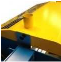
Afzuigpunt rook en stof

De vernieuwde PalletSaw is uitgerust met afzuigpunten voor rook, stof en zaagsel, zodat men naast de besparingen op de reciprozaagjes ook veel minder rook en stof heeft. Deze afzuigpunten kunnen worden aangesloten op een centraal afzuigstelsel of op een losse unit die door CekamonSaws wordt geleverd. Het dragen van mondkapjes is daarmee overbodig geworden. Voor informatie en prijsopgave Klik hier