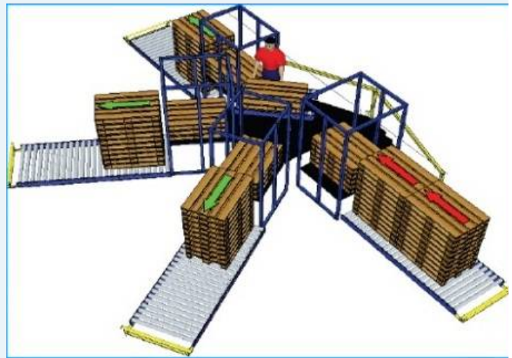
Tekening mogelijke opstelling