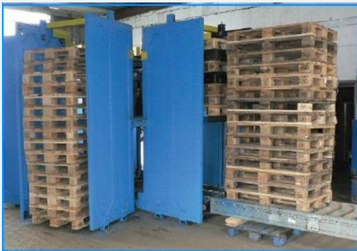
Bouwjaar 2015 ZGAN

Dit zo goed als nieuwe Sorteerplatform bestaat uit: