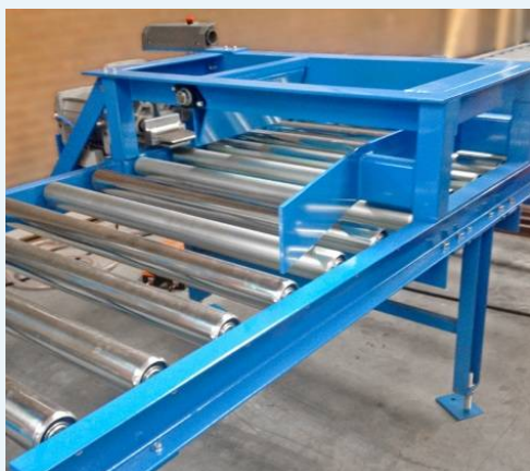
Bouwjaar 2015 ZGAN

Deze gebruikte Palletpers is zo goed als nieuw en de-monteert kapotte planken en klossen. Werkt sneller dan de reciprozaagmachines en geeft besparing op recipro-zaagjes. Voor de werking zie de video hiernaast.